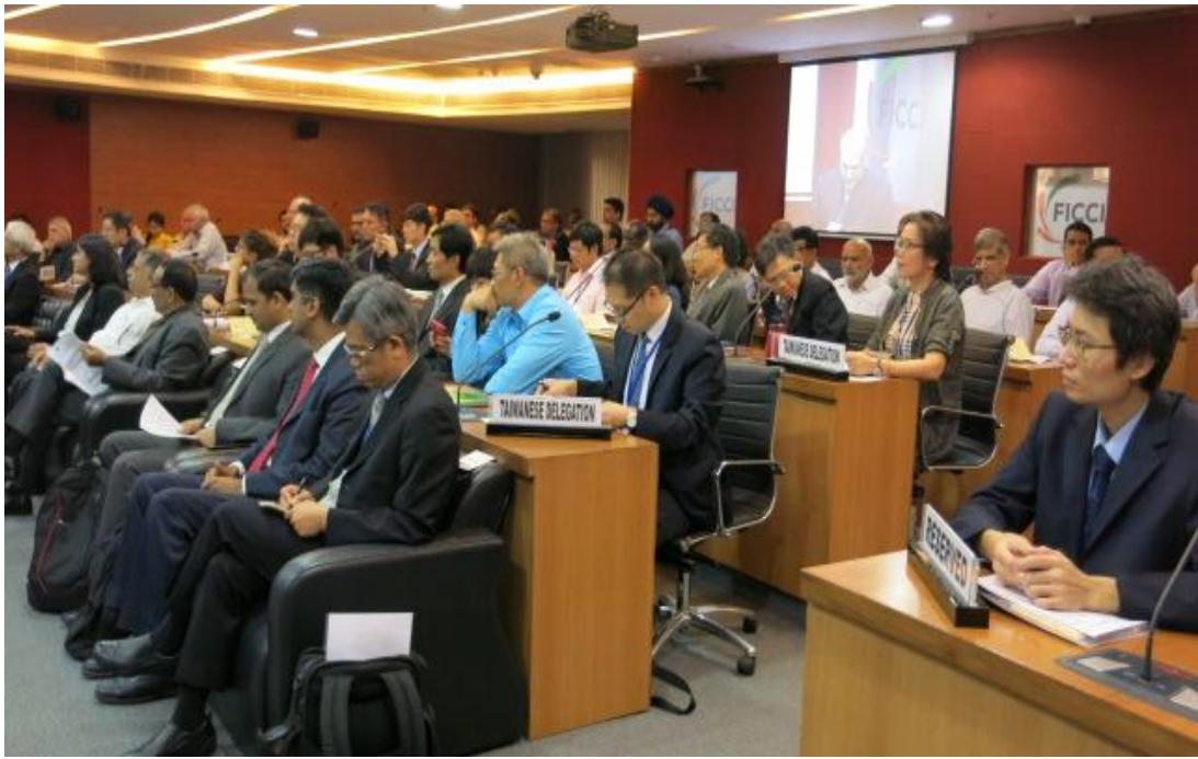
10月5日「第16屆台印(度)經濟聯席會議」大會出席情形