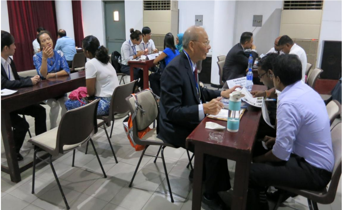
10月3日於斯里蘭卡貿易洽談情形