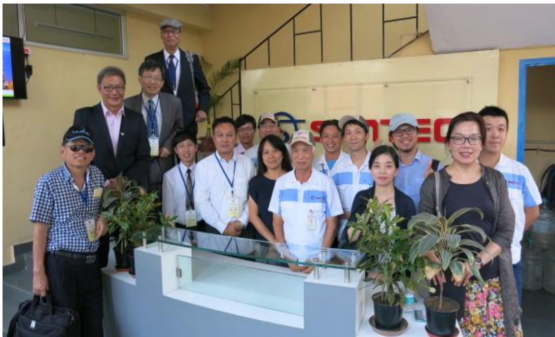
團員 10 月 7 日參訪印度信通有限公司