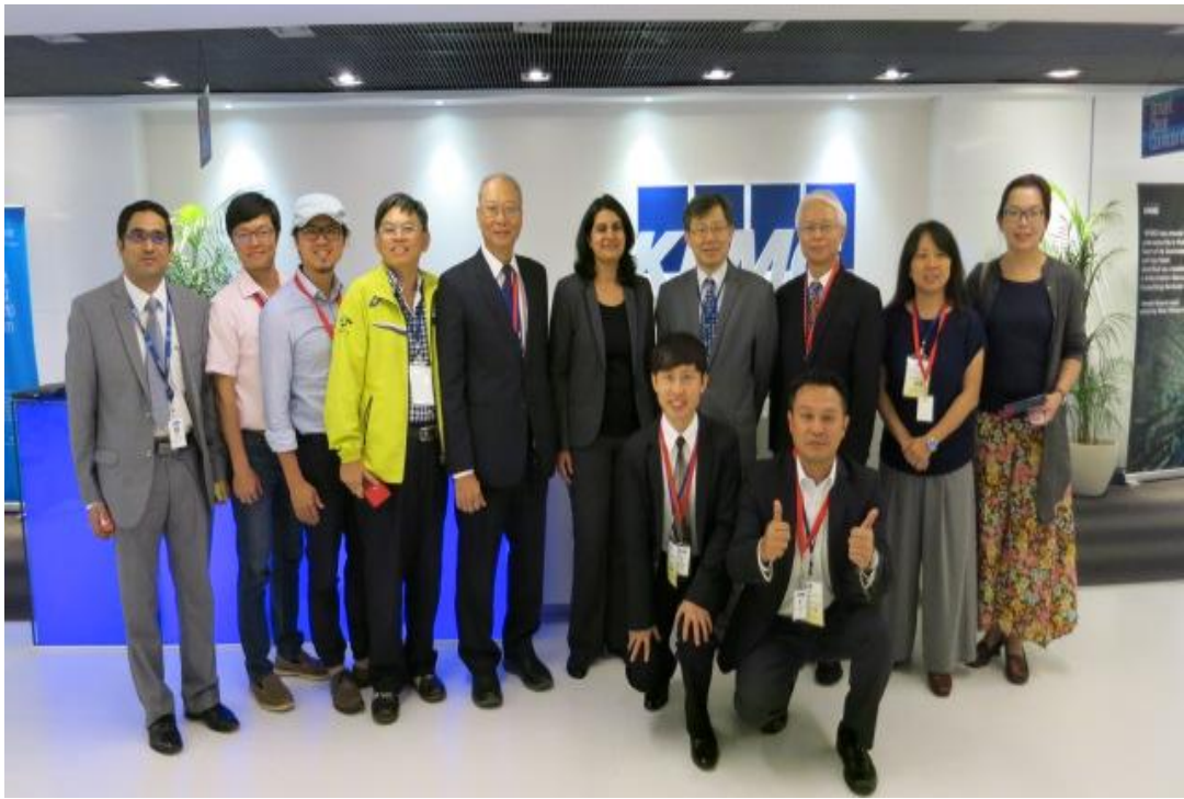
團員 10 月 7 日拜會 KPMG